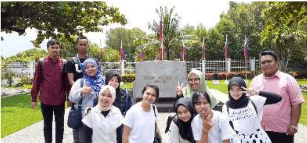
15. American – Manila Cemetary and Memorial, Manila