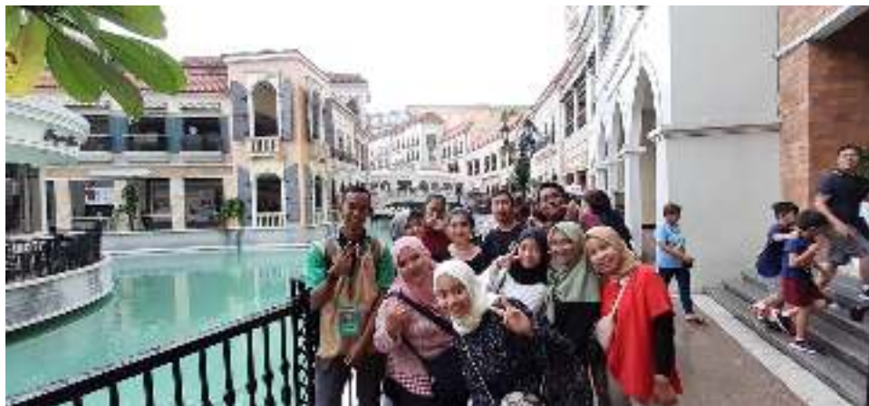
17. Bonifacio City